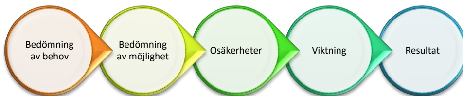
Figur 1 Illustration som redovisar uppbyggnad av det modellverktyg som använts för att bedöma VA-planområdenas behov och möjlighet till förändrad VA-situation.

Manualen redovisar nedanstående moment. Tillvägagångssätt för avgränsning av VA-planområden eller vilket underlag som behövs för att utföra bedömningarna redovisas inte här.